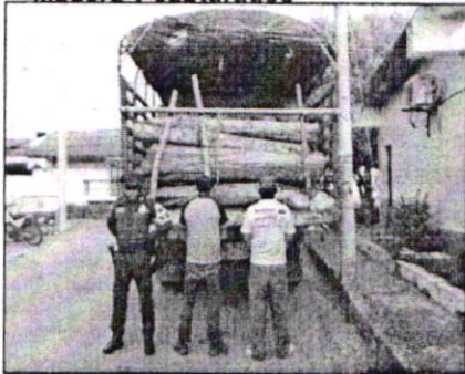
Madera y capturados