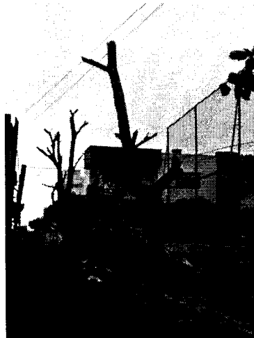
Imagen 5. Árboles podados drásticamente