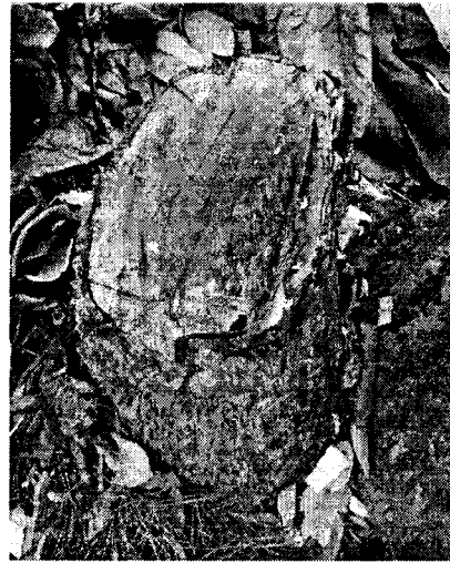
Imagen 2. Tocón del árbol 1 que fue talado sin permiso