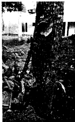
Imagen 4. Evidencia de intervención antrópica sobre los árboles para ir disminuyendo su capacidad de sobrevivencia