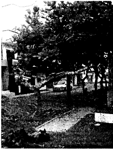
Imagen 1. Vista de los árboles aun sin Poda drástica y árbol 9 que fue podado y posteriormente Talado