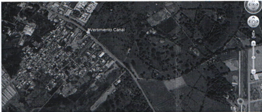
Imagen Satelital del sector inspeccionado