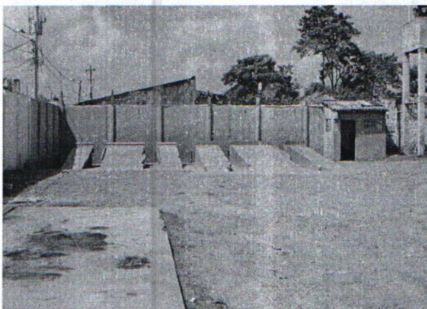
Foto N° 1. Se puede observar zona de lavados en abandono al momento de la visita.