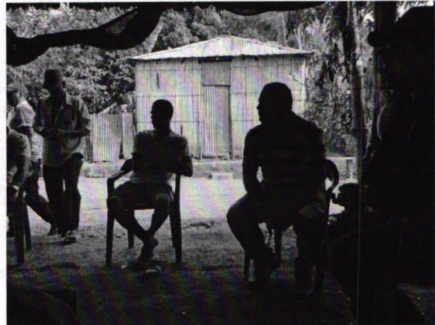
Imagen 1 y 2. Reunión con la comunidad, atendiendo sus inquietudes.