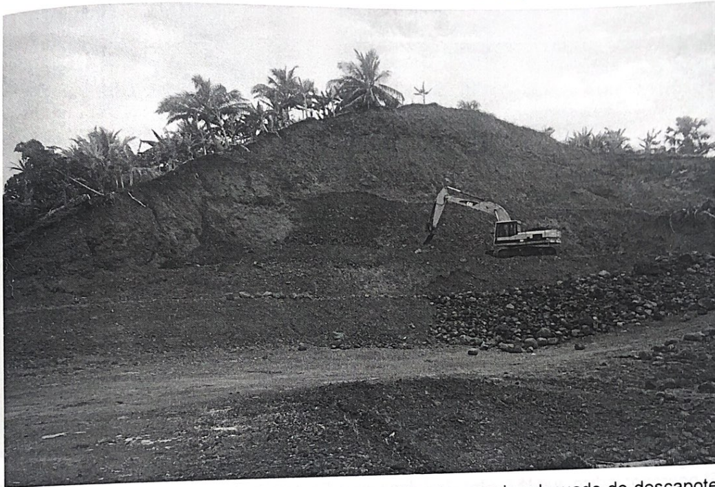
Imagen 4. Frente de explotación activo, sin medidas de manejo adecuado de descapote, diseño ni planteamiento minero.

Las vías internas de la cantera se encontraban en mal estado.