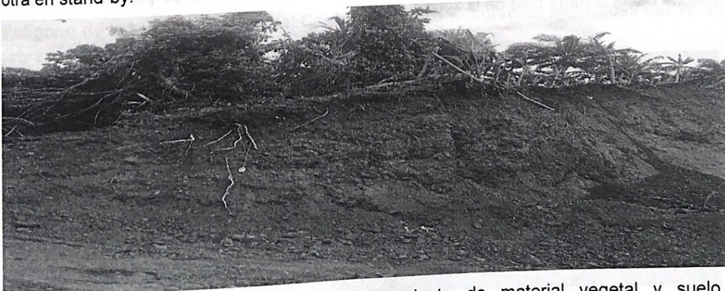
Imagen 5. Inadecuado manejo y aprovechamiento de material vegetal y suelo. Obsérvense árboles caídos y vegetación notablemente afectada por la actividad de extracción.

La maquinaria presente en la cantera correspondía a 2 retroexcavadoras, una activa y otra en stand-by.