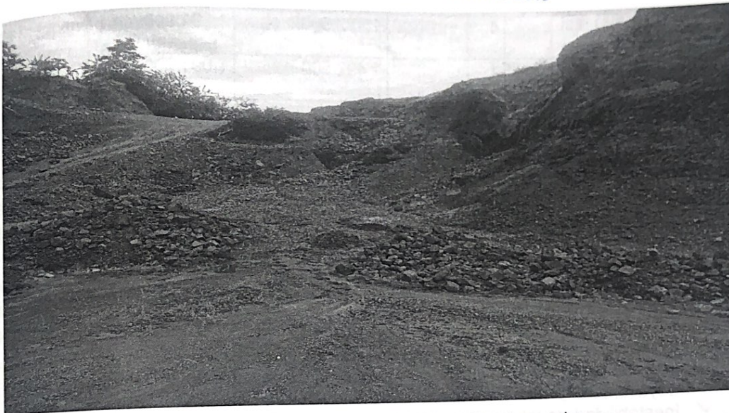
Imagen 8. Material suelto apilado sin medidas de protección ni manejo. Puntos georreferenciados: Coordenadas Geográficas