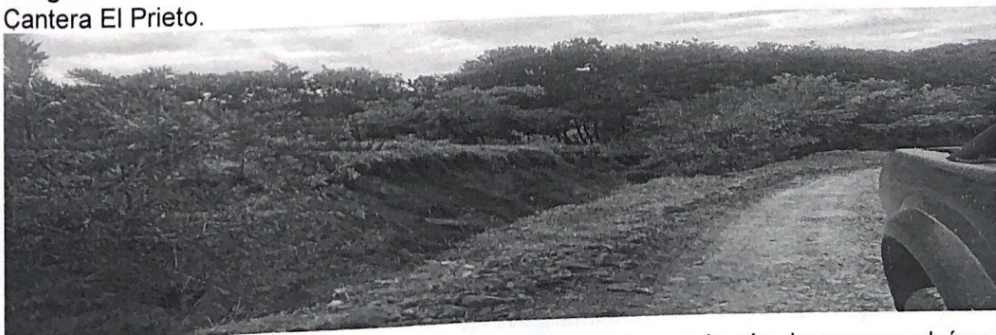
Imagen 2. Procesos de remoción en masa observados en la vía de acceso al área de explotación de la Cantera El Prieto.