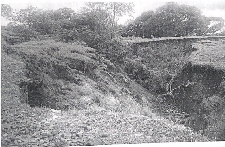
Imagen 1. Procesos erosivos intensos observados alrededor de la vía de acceso a la Cantera El Prieto.

Las vías internas de la cantera se encuentran en mal estado, y predominan en la zona procesos erosivos progresivos y remoción en masa.