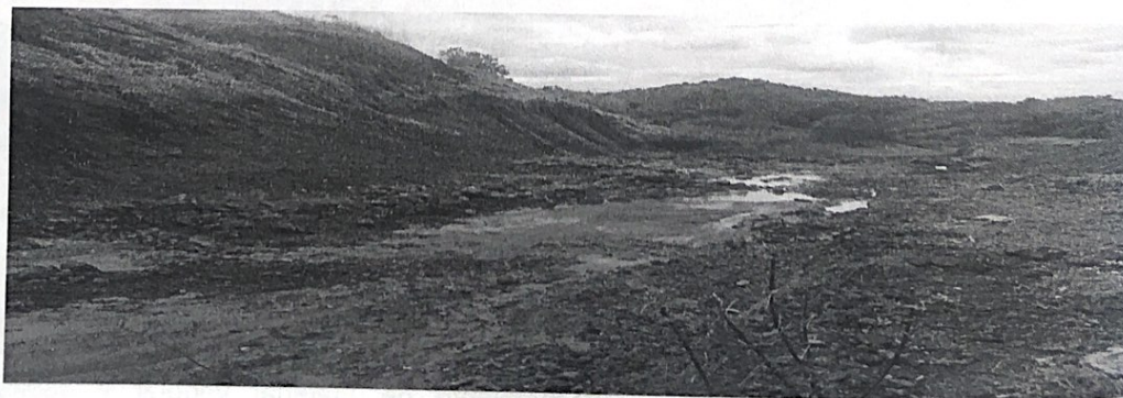
Imagen 7. Manejo inadecuado de aguas de escorrentía en la zona. No se observan canales definidos.

Hacia la vía de salida de la cantera, se observó una corriente de posible escorrentía natural hacia la parte baja de la zona.