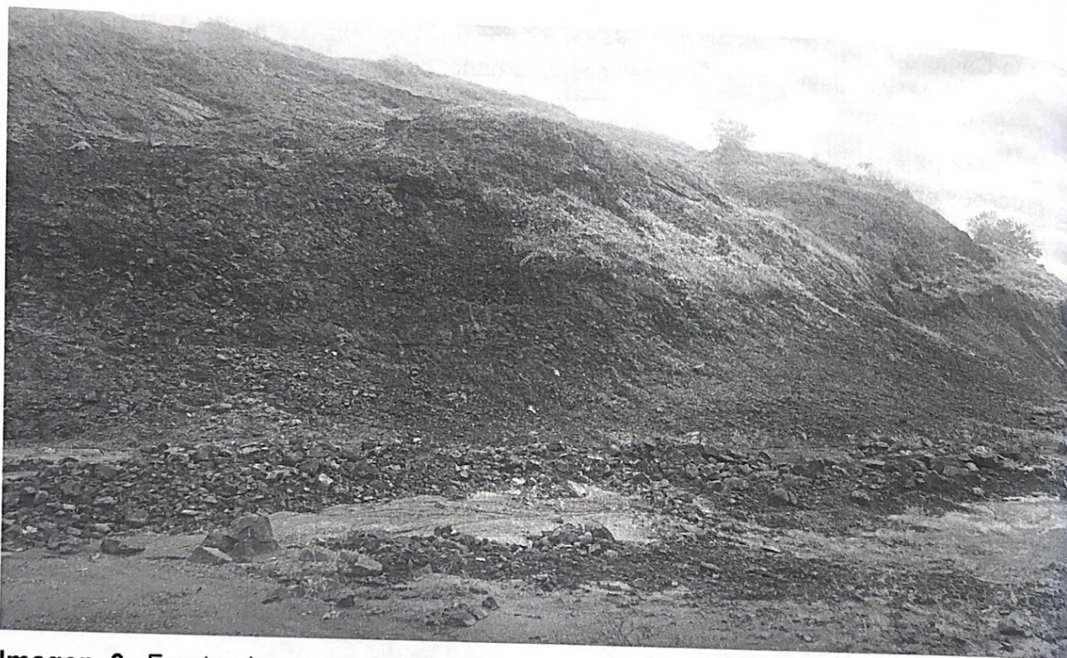
Imagen 3. Frente de explotación con material duro parcialmente inactivo, obsérvense parches de revegetación natural.

Se observaron dos frentes de explotación: un frente con material duro, parcialmente inactivo, ubicado sobre las coordenadas: 9^{\circ}03' 6'' N 76^{\circ}14'41'' O sin diseño ni planteamiento minero, talud de más de 20 metros de altura, sin medidas de protección de erosión y presencia de algunos procesos de revegetación natural.