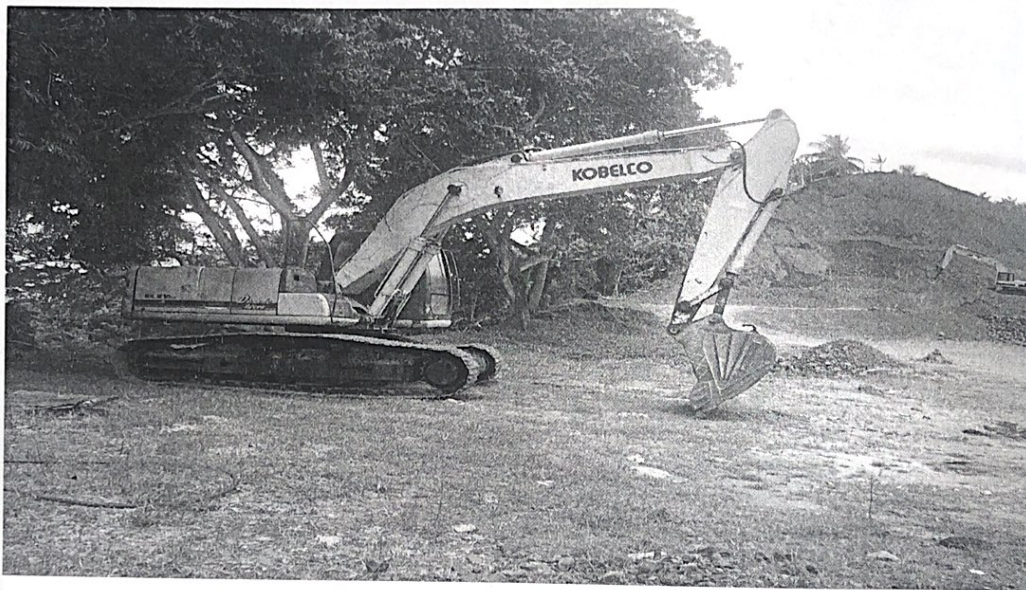
Imagen 6. Segunda retroexcavadora (inactiva) en la Cantera El Prieto.

El operador indicó que la producción diaria en la Cantera El Prieto oscila entre los 15 y 20 volcos diarios.