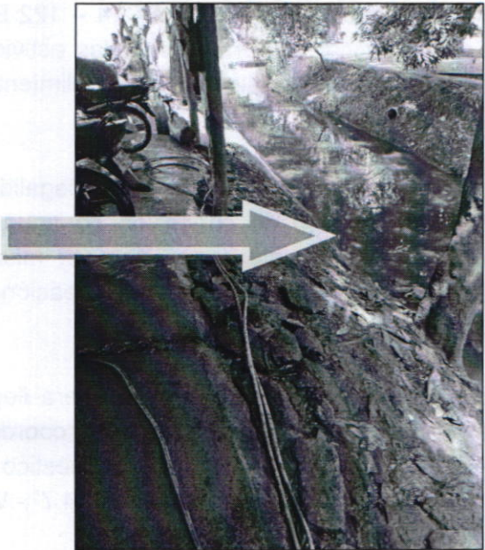
Foto No.4. Canal.

Canal de drenaje de Aguas lluvias donde realizan el vertimiento