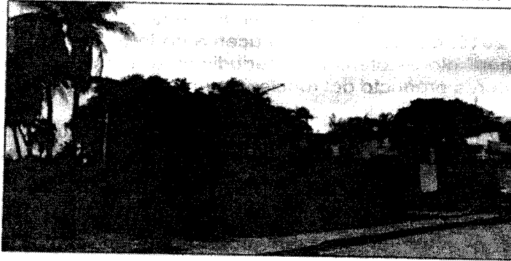
Foto 2. ENTRADA A FINCA FLOR DE MARIA