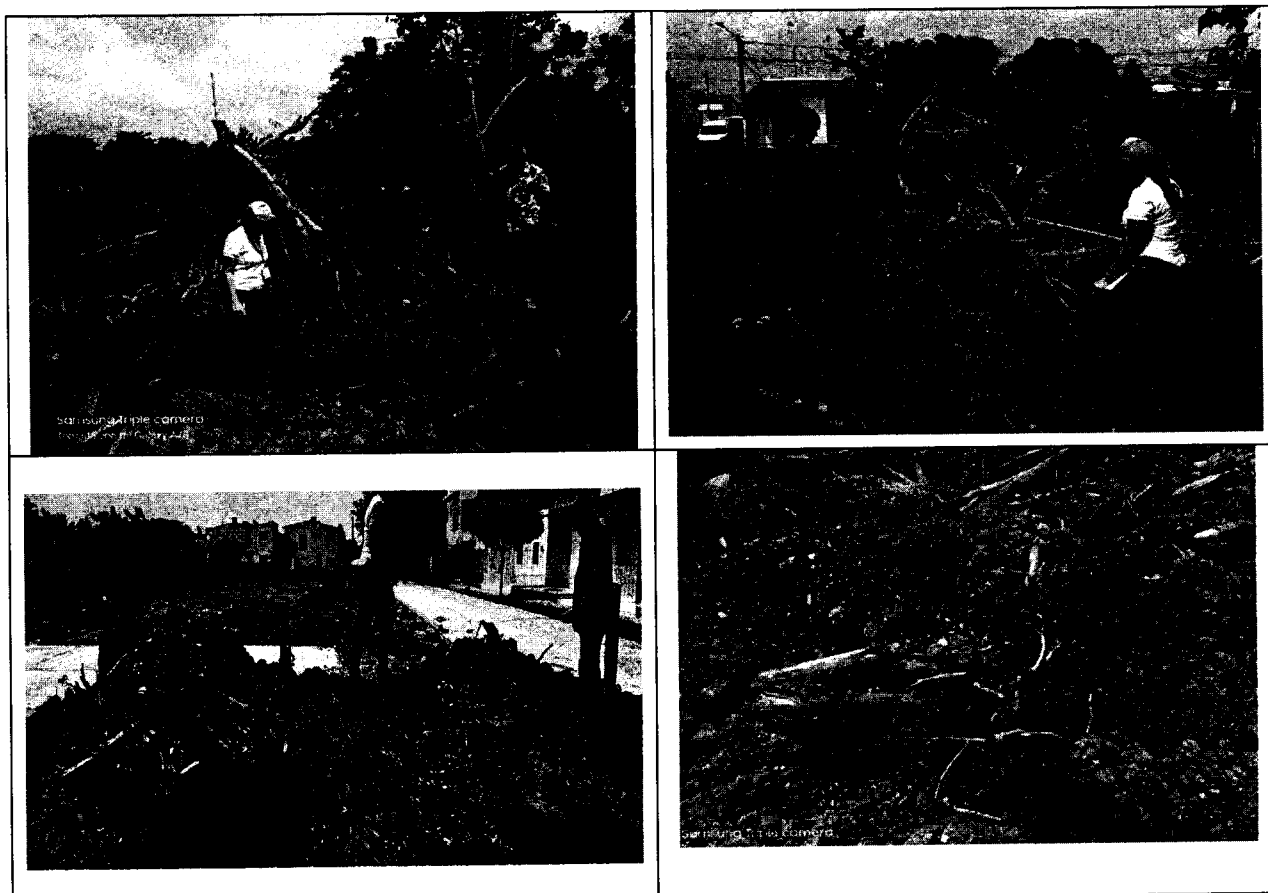
Fotos No. 1. Se observa los tocones de los individuos talados, en área de espacio público adyacente a las labores de pavimentación en el lote de referencia o intervenido en el Barrio Villa Helena Municipio de Montería