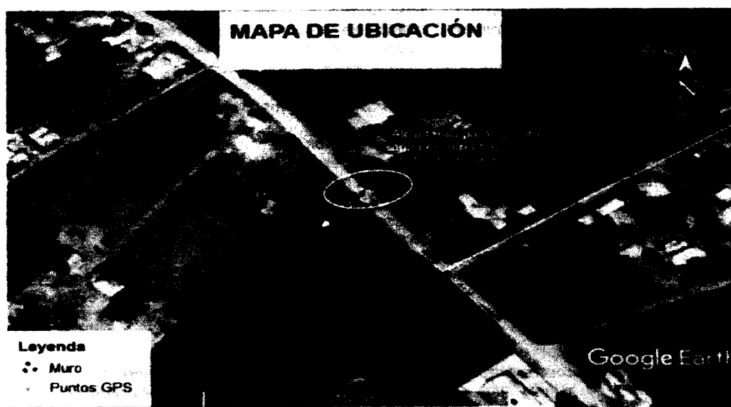
Imagen N°1. Mapa de ubicación