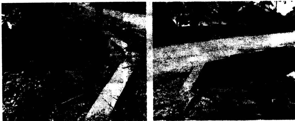
Fotos N°1 y 2. Puente localizado sobre la vía. (Fotografías tomadas el día 10/07/2018)