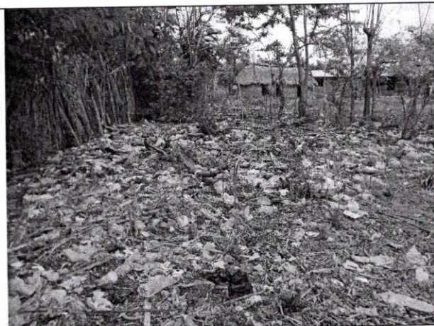
Foto N° 1. Vista de residuos sólidos en punto crítico. Abril 30 de 2019.

Los residuos sólidos presentes en los puntos críticos pueden ser dispersados por el viento y las lluvias por lo que podrían llegar a cuerpos de agua, como es el caso de la ciénaga de Momil, afectando este recurso natural, además del suelo y del agua subterránea y posiblemente perjudicar también a otras comunidades.