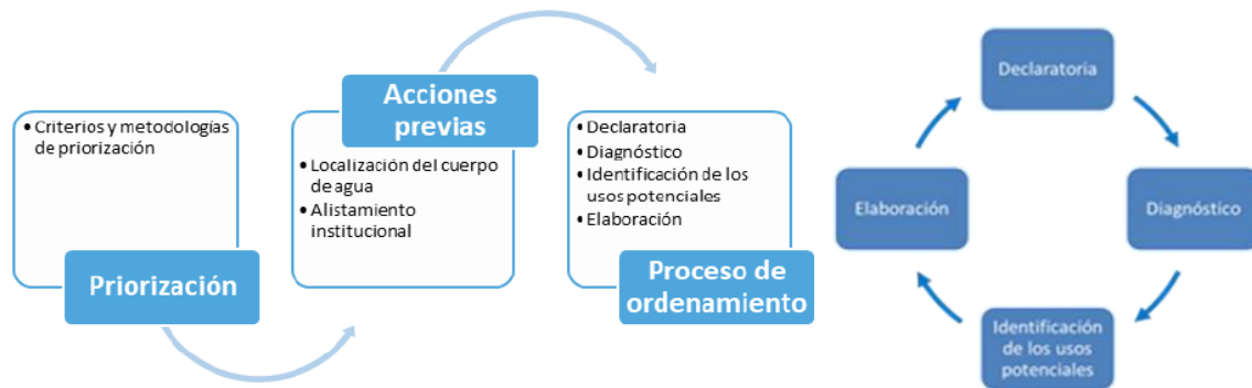
Figura 3. Esquema del proceso de ordenamiento del recurso hídrico.

PORH. La guía para el ordenamiento del recurso hídrico continental superficial, define un Marco Metodológico de trabajo así: