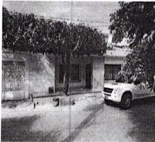
Ilustración 3. Casa paralela a la Planta Eléctrica