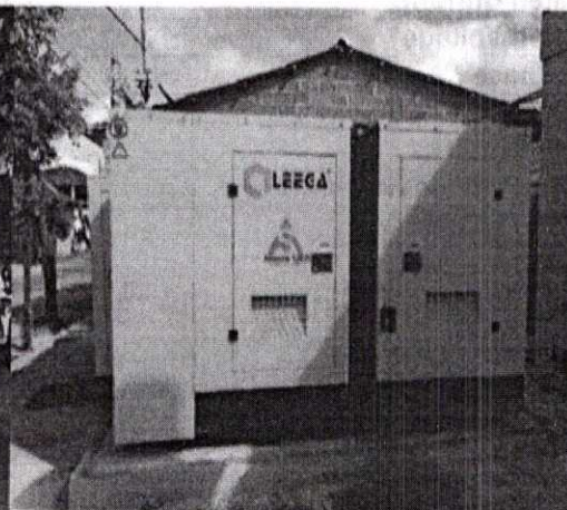
Ilustración 4. Parte trasera de Planta Eléctrica