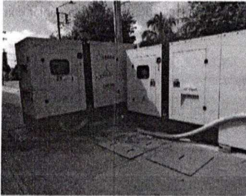
Ilustración 1. Ubicación de la Planta Eléctrica