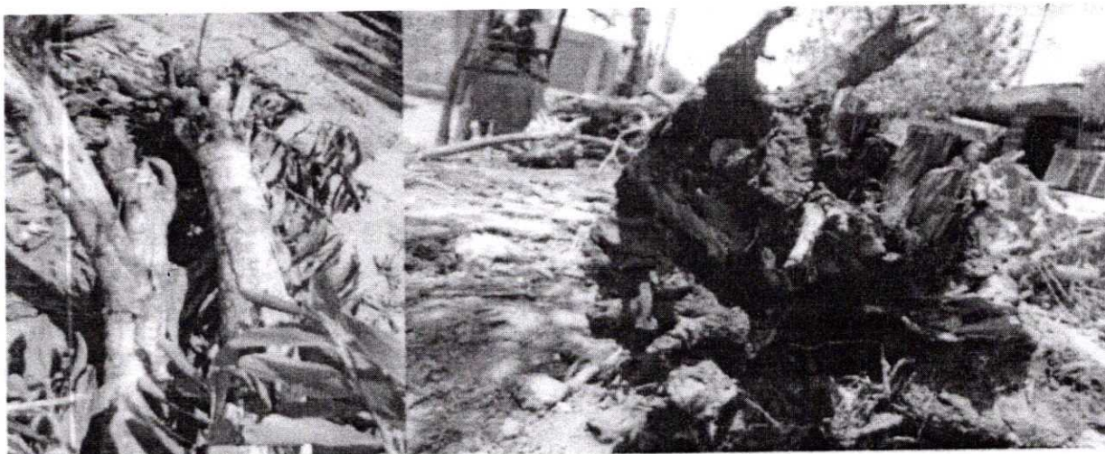
Imagen N° 2: Acasio con base hueca y comején en el tallo