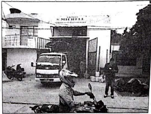
Foto 1. Lácteos Michell.