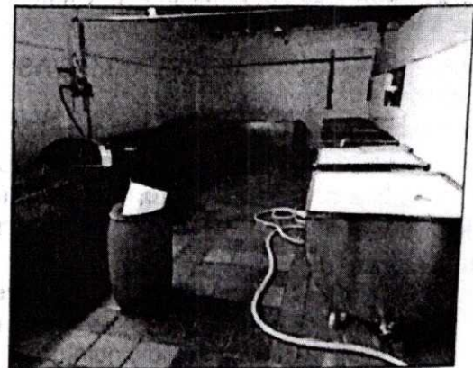
Foto 2. Zonas de procesos.