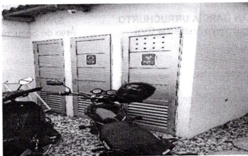
Imagen.1- deposito central respel.