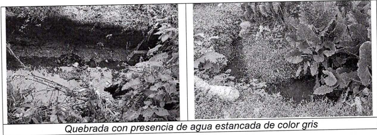
Quebrada con presencia de agua estancada de color gris