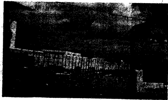
Imagen 2: Residuos de construcción.