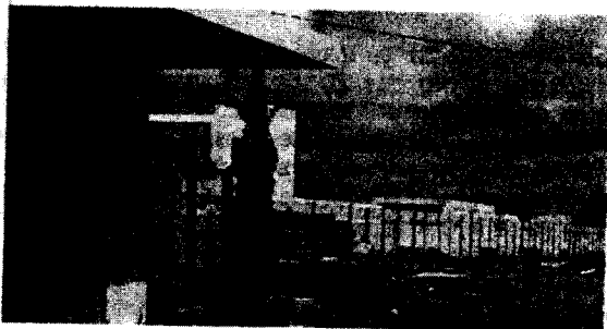
3. Residuos de construcción.