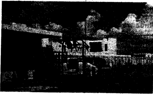
Imagen 1: Residuos de construcción.