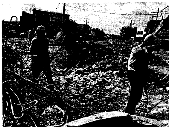
Imagen N° 7. Nótese taponamiento del canal por la inadecuada disposición de material sobrante