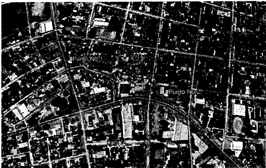
Imagen No. 1 Localización del "Mercadito del Sur" y punto donde se evidencio taponamiento, ubicado en la estación de servicio.