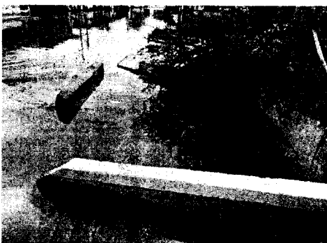
Imagen N° 3. Evidenciamos inundación ocasionada por obstrucción del canal de desagüe.