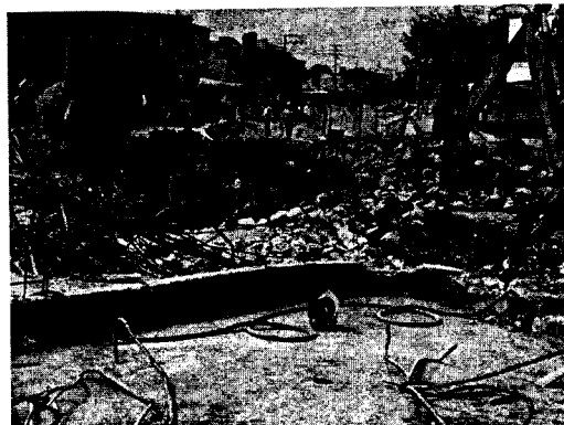
Imagen N° 5 – N° 6. Se evidencia que los trabajos realizados ocasionan taponamiento del canal.