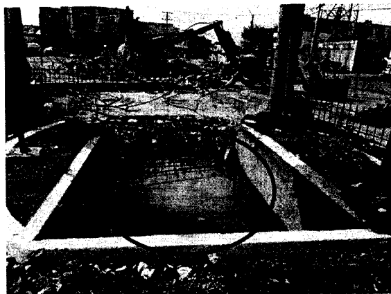
Imagen N° 8. Se observa claramente el estancamiento de aguas por taponamiento del canal.