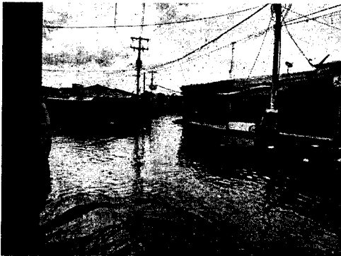
Imagen N° 1. Se evidencia inundación en acceso al Mercadito del Sur.

Se realizó recorrido en el Mercadito Del Sur, donde se pudo evidenciar lo siguiente: