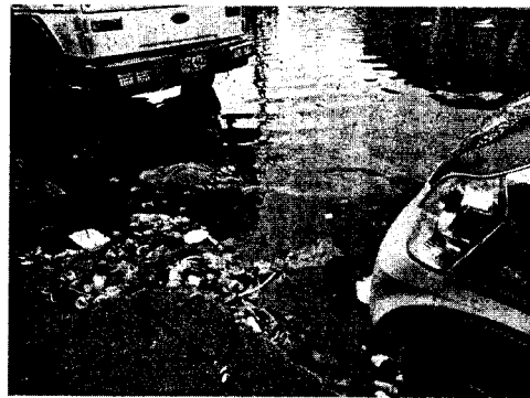
Imagen N° 2. Se evidencia disposición inadecuada de desechos arrojados por los usuarios y trabajadores de la central de abasto.