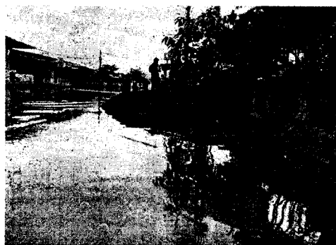
Imagen N°4. Evidenciamos inundación ocasionada por aguas lluvias en el canal.