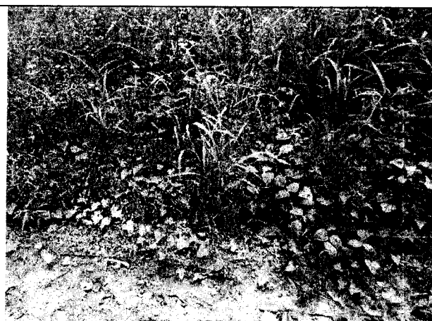
Fig. N° 2 Aspecto general del sitio. Agosto 30 de 2019