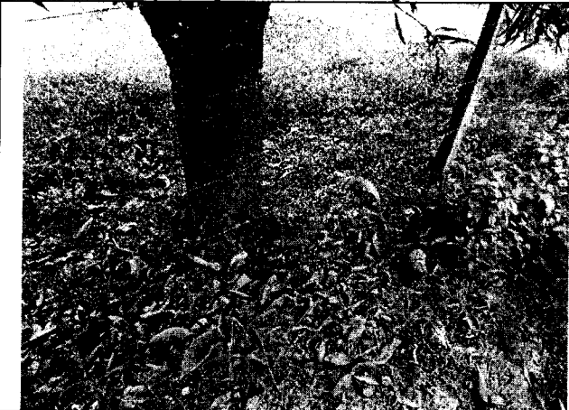
Fig. N° 9 Aspecto general del sitio. Agosto 30 de 2019