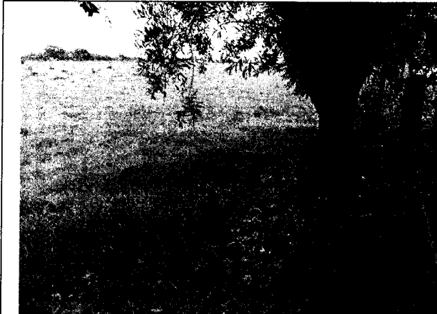
Fig. N° 7 Aspecto general del sitio. Agosto 30 de 2019