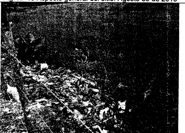
Fig. N° 12 Aspecto general del sitio. Agosto 30 de 2019