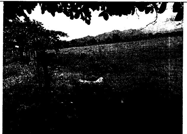
Fig. N° 8 Aspecto general del sitio. Agosto 30 de 2019