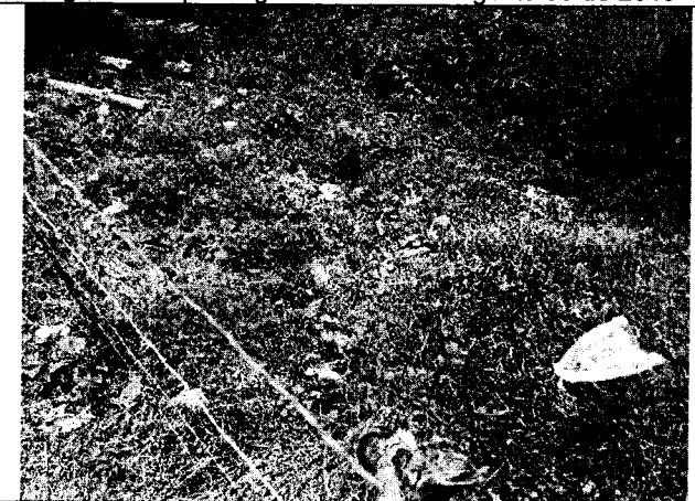
Fig. N° 11 Aspecto general del sitio. Agosto 30 de 2019