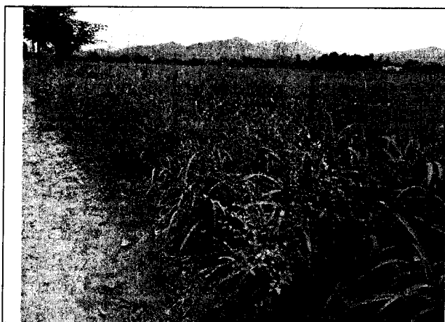
Fig. N° 1 Aspecto general del sitio. Agosto 30 de 2019