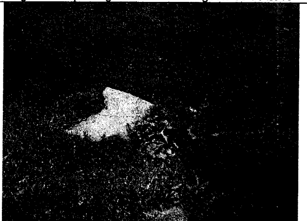
Fig. N° 10 Aspecto general del sitio. Agosto 30 de 2019