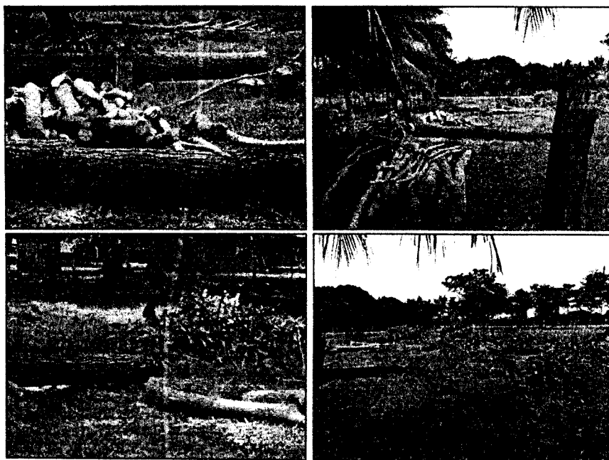
Características de los arboles