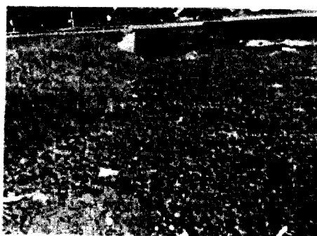
Imagen N°6. Se evidencia residuos de material sólido en el canal de drenaje ubicado en el Puente El Purgatorio en el km 8 vía Montería – Planeta Rica.