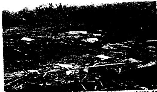
Imagen N°4. Se observó residuos sólidos en el lote de la urbanización Villa Melissa