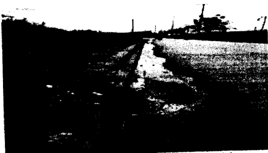
Imagen N° 3. Evidenciamos encharcamiento del agua que se vierte desde el lote hacia la calle de la