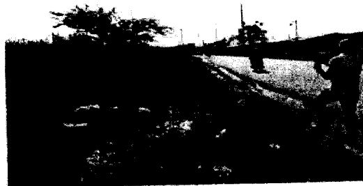
Imagen N° 2. Se evidencia la filtración y escumamiento del agua hacia la calle en la urbanización Villa Melissa.