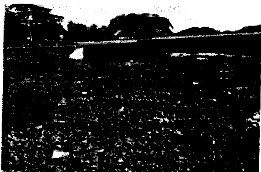
Imagen N° 5. Se evidencia canal de drenaje ubicado en el Puente El Purgatorio en el km 8 vía Montería – Planeta Rica.