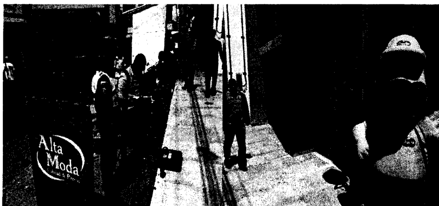
Instalacion del equipo de medicion