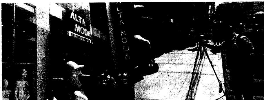
Fachada principal Alta Moda