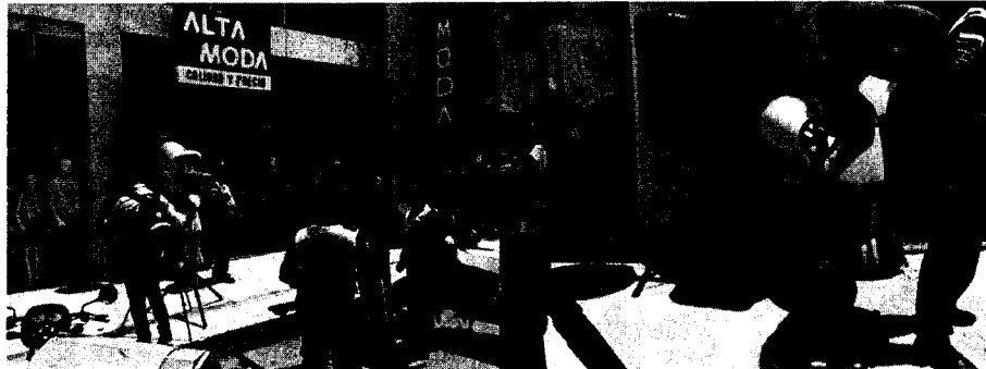
Acompañamiento de las autoridades de policía