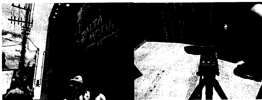
Fachada del establecimiento