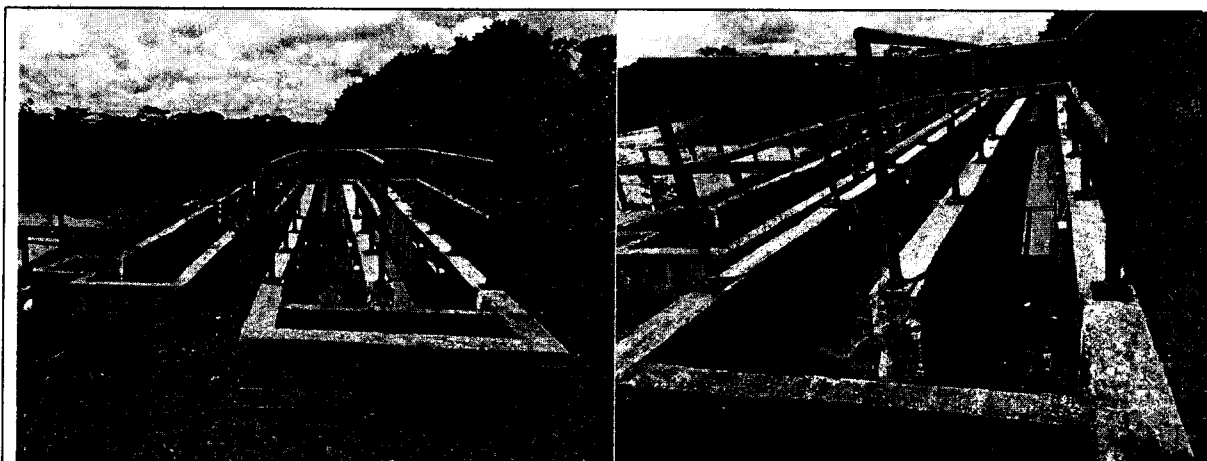
Estructura del tratamiento preliminar