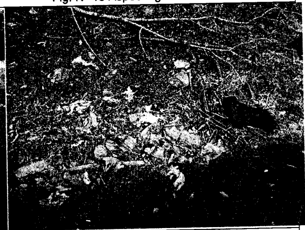
Fig. N° 18 Aspecto general del sitio.

En el punto crítico N° 1, se pudo evidenciar que se viene presentando inadecuada disposición de residuos sólidos, en la puerta de ingreso de una finca y a lo largo de aproximadamente 100 metros de distancia. Al momento de la visita, se pudo apreciar la presencia de góleros ( Coragyps atratus ) rondando en el lugar y presencia de olores ofensivos y nauseabundos. Se observaron residuos como cartón, bolsas plásticas, frascos de aceite, botellas plásticas y de vidrio, costales y bolsas plásticas llenas de basura, baldosas, restos de ramas y de poda de árboles, pedazos de tejas de fibrocemento ("Eternit") ondulado, residuos de alimentos, gran cantidad de bolsas de pollo congelado, restos de partes de televisor, plásticos, bolsas de alimento de perro, costales llenos de abono, desechables y envolturas de alimentos, sandalias, latas, restos de bolso, restos de sanitario, tubos y más residuos de construcción y demolición (RCD), entre otros. En el lugar se pudo observar también una valla prohibitiva de disposición de