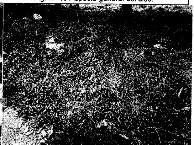
Fig. N° 12 Aspecto general del sitio.