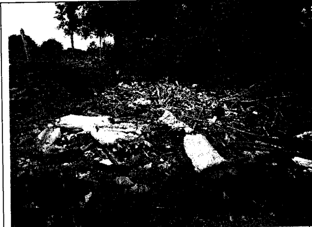
Fig. N° 3 Aspecto general del sitio.