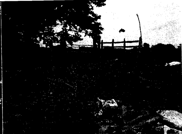
Fig. N° 4 Aspecto general del sitio.