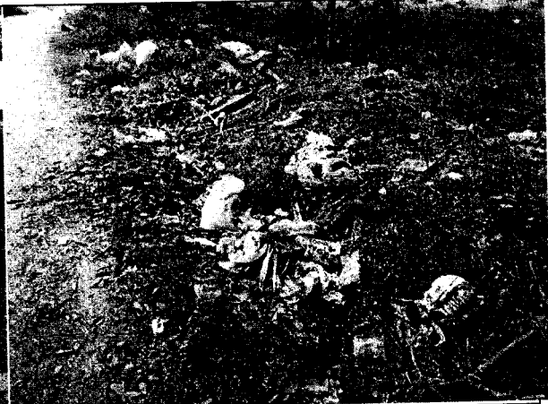
Fig. N° 8 Aspecto general del sitio.