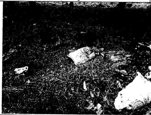
Fig. N° 11 Aspecto general del sitio.