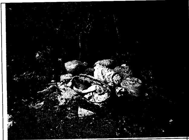
Fig. N° 15 Aspecto general del sitio.