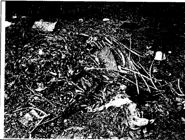
Fig. N° 9 Aspecto general del sitio.