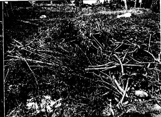
Fig. N° 6 Aspecto general del sitio.