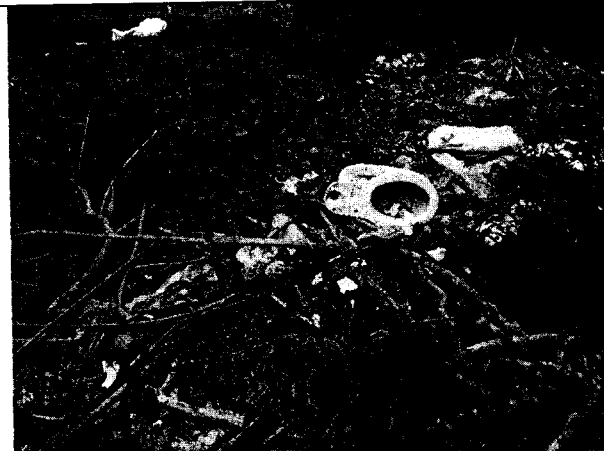
Fig. N° 5 Aspecto general del sitio.