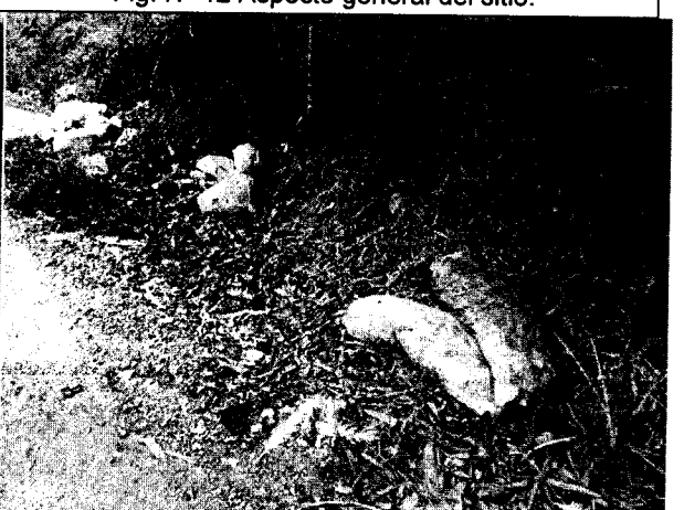
Fig. N° 14 Aspecto general del sitio.