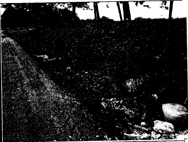
Fig. N° 16 Aspecto general del sitio.