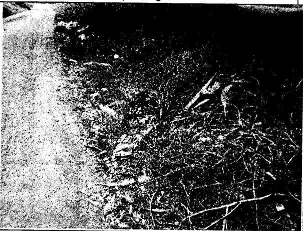
Fig. N° 13 Aspecto general del sitio.