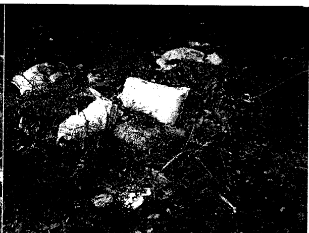
Fig. N° 10 Aspecto general del sitio.