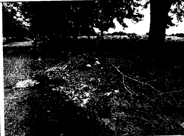
Fig. N° 7 Aspecto general del sitio.