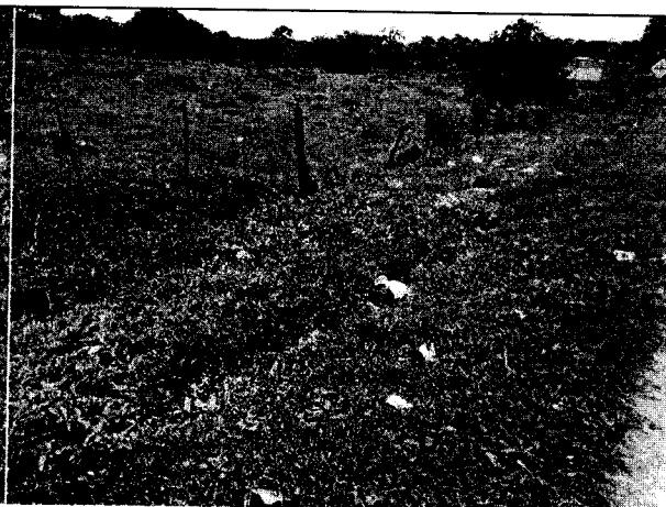
Fig. N° 12 Aspecto general del sitio.