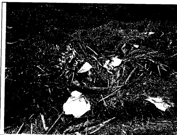
Fig. N° 9 Aspecto general del sitio