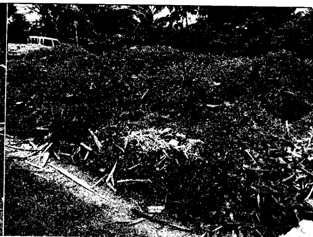
Fig. N° 10 Aspecto general del sitio