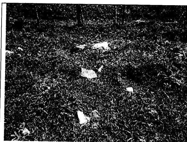
Fig. N° 11 Aspecto general del sitio.