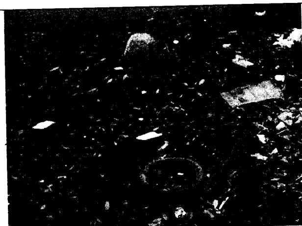
Foto 2: Residuos dispuestos en Punto Crítico en sector Rancho Grande. Julio 8 de 2019.