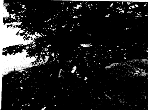
Foto 6: Relleno con RCD en sector Rancho Grande. Julio 8 de 2019.