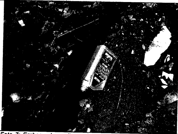
Foto 7: Embase de aceite vacío en punto crítico en sector Rancho Grande. Julio 8 de 2019.