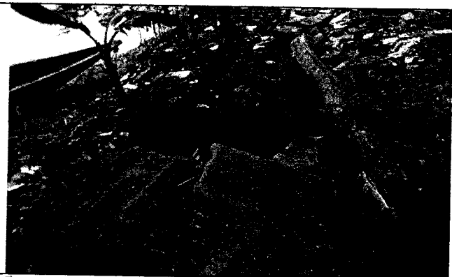
Foto 3: Residuos dispuestos en punto crítico en sector Rancho Grande. Julio 8 de 2019.