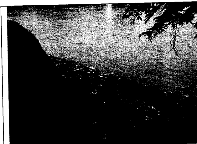
Foto 1: Vista general de punto crítico en sector Rancho Grande. Julio 8 de 2019.

La situación se hace más crítica, teniendo en cuenta que los puntos se ubican en el cauce del río Sinú, por lo que los residuos sólidos y líquidos llegan hasta el río o son arrastrados por este con el aumento de su cauce en las crecientes por las lluvias, afectando este y otros cuerpos de agua (caños, ciénagas, mar Caribe, etc.), además del suelo y posiblemente perjudicar también a otras comunidades.