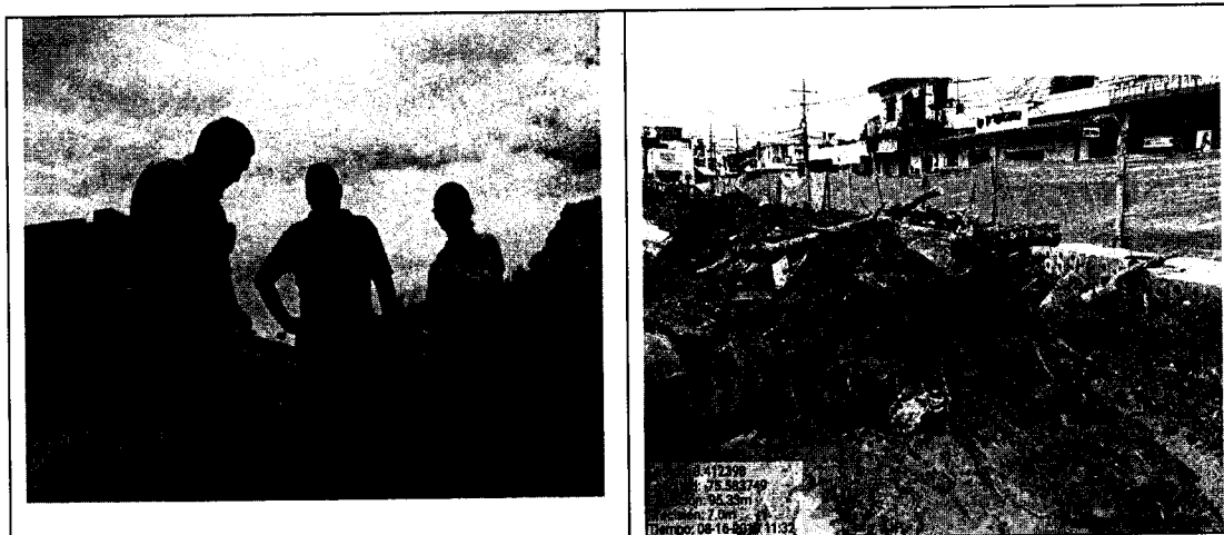
Fotos No. 2. Se observa la adecuación del área a intervenir y desechos producto de la presunta tala ilegal de dos individuos arbóreos de la especie ( Ficus elástica ) de acuerdo con la situación observada en el Parque principal del municipio de Planeta Rica al interior del Parque de acuerdo con el contrato de obra civil no. 385-2019.