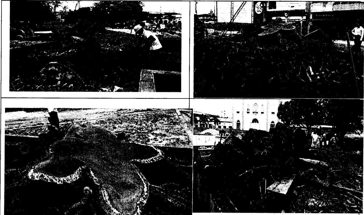
Fotos No. 1. Se observa los tocones de los presuntos individuos arbóreos talados, en área de espacio público adyacente a las labores de obra civil en el Parque Central del Municipio de Planeta Rica.