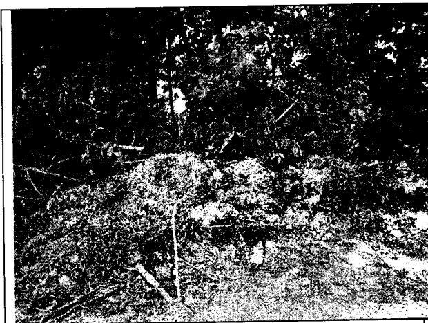
Fig. N° 7 Aspecto general del sitio.