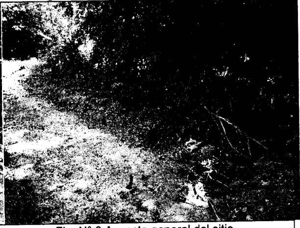
Fig. N° 8 Aspecto general del sitio.