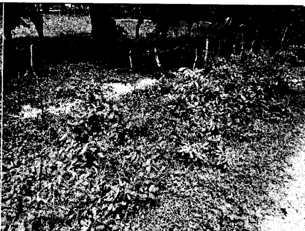
Fig. N° 4 Aspecto general del sitio.