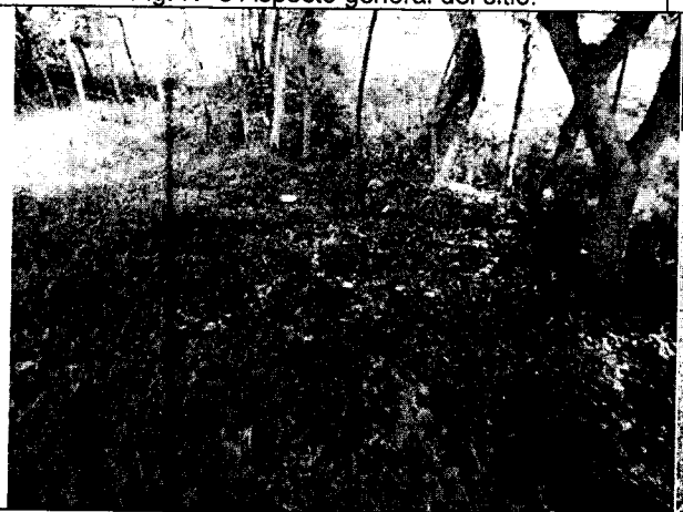
Fig. N° 5 Aspecto general del sitio.