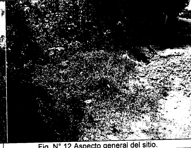
Fig. N° 12 Aspecto general del sitio.