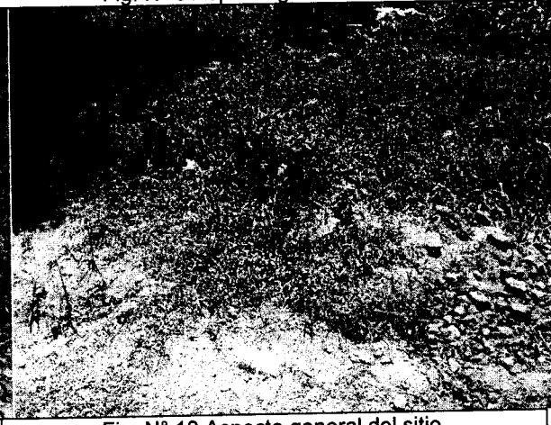
Fig. N° 10 Aspecto general del sitio.