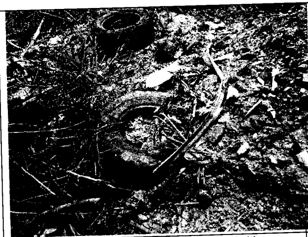
Fig. N° 3 Exposición de llantas en el sitio.