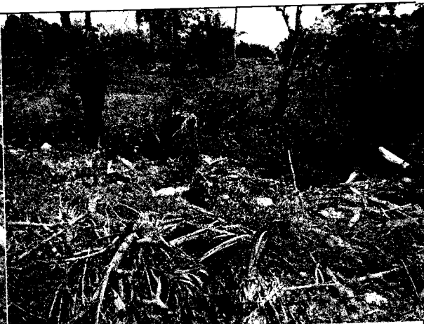
Fig. N° 4 Acumulación de residuos sólidos en el sitio.