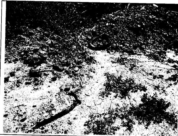
Fig. N° 1 Acumulación de residuos en el sitio.