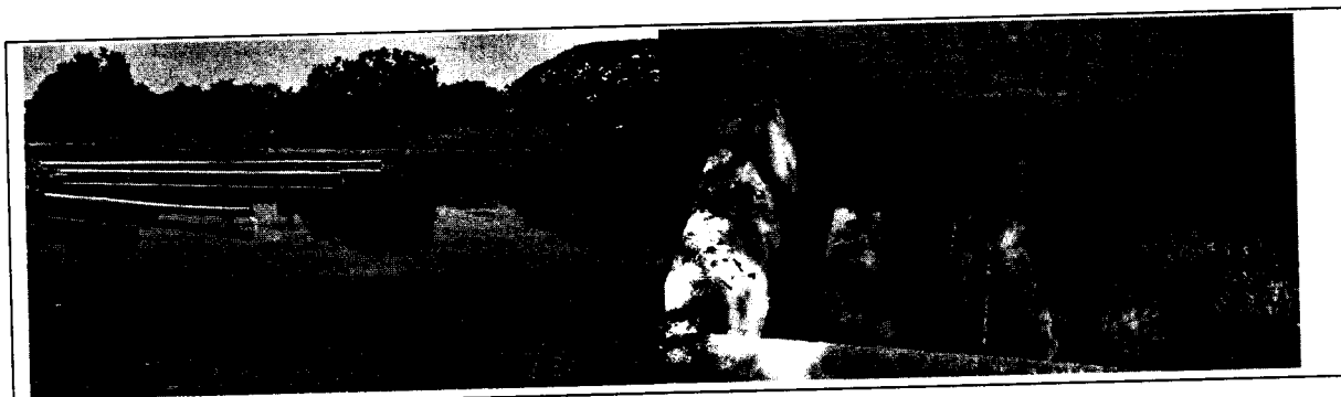
Descarga de la tubería hacia las lagunas y vertimiento

No existe cerco perimetral definido ni barrera viva para control de malos olores, no cuenta con geomembrana. Los sólidos productos de la limpieza de los desarenadores y las estructuras de interconexión no se les están dando el tratamiento adecuado como se puede en la siguiente Fotografía No, 7