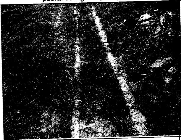
Fig. N° 3 Canales perimetrales obstruidos.