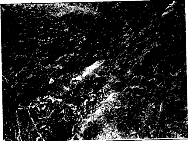
Fig. N° 2 Canales perimetrales obstruidos por maleza y tierra.