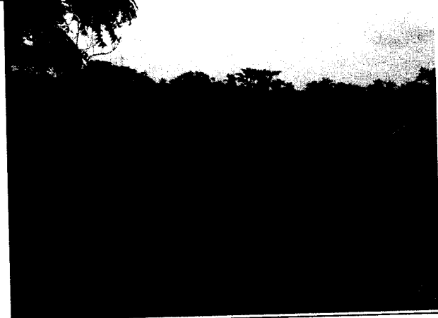
Fig. N° 4 Aspecto general del predio.