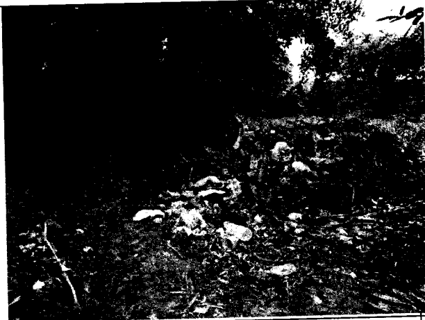
Fig. N° 1 Acumulación de residuos a la entrada de la puerta de ingreso principal.