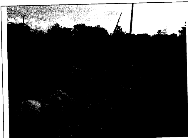
Fig. N° 3. Gran cantidad de residuos sólidos a los costados de la carretera.