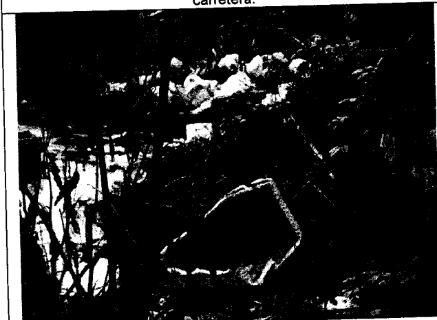
Fig. N° 5. Disposición de "icopor" en pequeño cuerpo de agua.