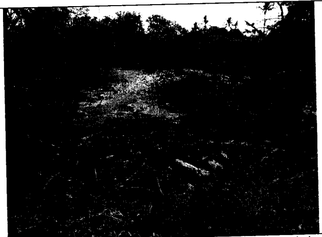
Fig. N° 4. Acumulación de diferentes tipos de residuos alrededor de cuerpo de agua.