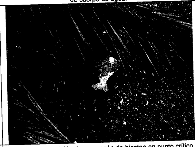
Fig. N° 6. Disposición de caparazón de hicotrea en punto crítico.