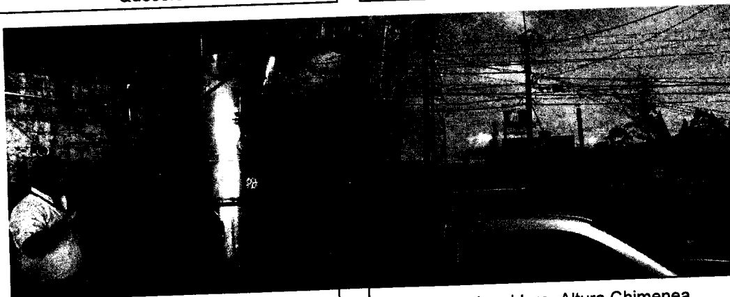
Imagen 3. Caldera.