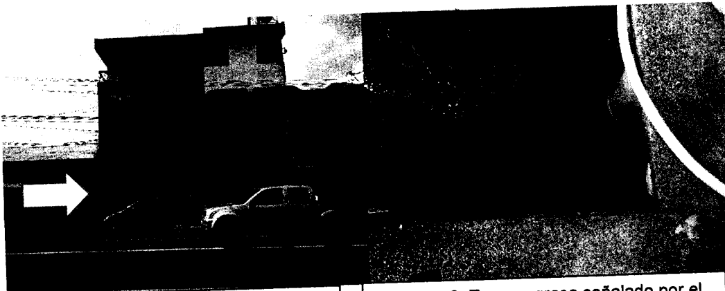
Imagen 1. Instalaciones, Lácteos Santa Quesera.