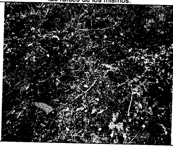
Fig. N° 7 Exposición de residuos en arbustos.