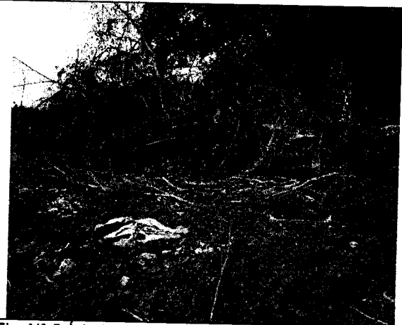
Fig. N° 5 Árboles caídos y acumulación de residuos en las raíces de los mismos.