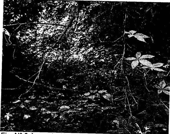
Fig. N° 8 Acumulación de residuos en la cobertura del predio.