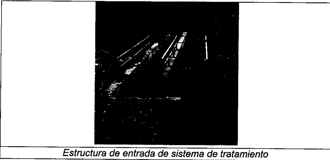
Estructura de entrada de sistema de tratamiento

El sistema de tratamiento está conformado por un tren que consta de cuatro lagunas, este es alimentado por una estación de bombeo, luego, las aguas son conducidas hasta una cámara de distribución, la cual reparte las aguas residuales hacia el tren de tratamiento existente.