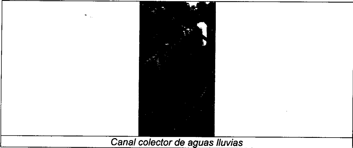
Canal colector de aguas lluvias

El vertimiento de este sistema se realiza en el Arroyo El Medio. Se evidencia presencia de espumas y no se perciben olores nauseabundos.