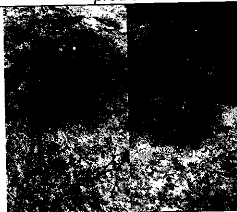
Fig. N° 4. Heces de ganado dentro del