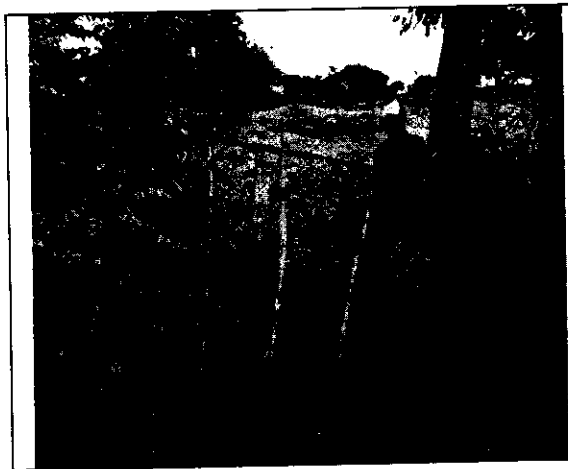
Fig. N° 1 Puerta de ingreso al predio.

Teniendo en cuenta lo anterior y según lo apreciado en la visita de seguimiento realizada, se puede determinar que el municipio no ha cumplido con lo exigido por la Autoridad Ambiental, pues los residuos fueron dispuestos sin tener en cuenta consideraciones técnicas que garantice la no afectación al entorno y a los predios vecinos.