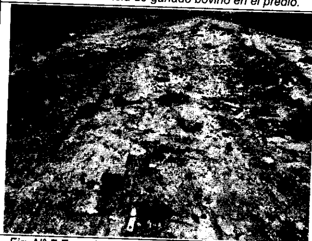
Fig. N° 7 Exposición de residuos debido a la erosión y escorrentía.