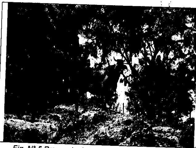
Fig. N° 5 Presencia de ganado bovino en el predio.