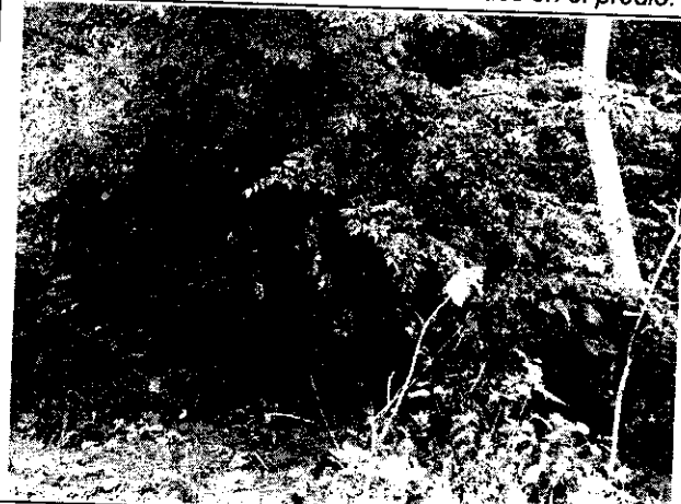
Fig. N° 8 Presencia de residuos en pequeño cuerpo de agua superficial.