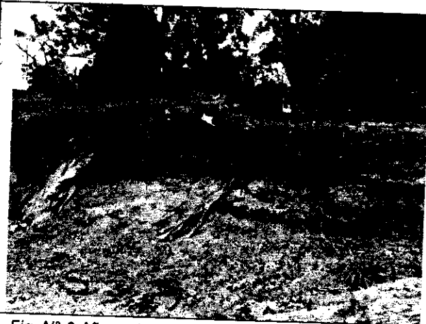
Fig. N° 6 Afloramiento de residuos sólidos en el predio.