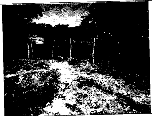
Fig. N° 6 Puerta de ingreso a predio vecino.