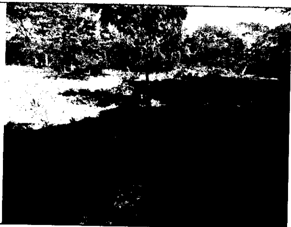
Fig. N° 2 Árboles talados en el predio.