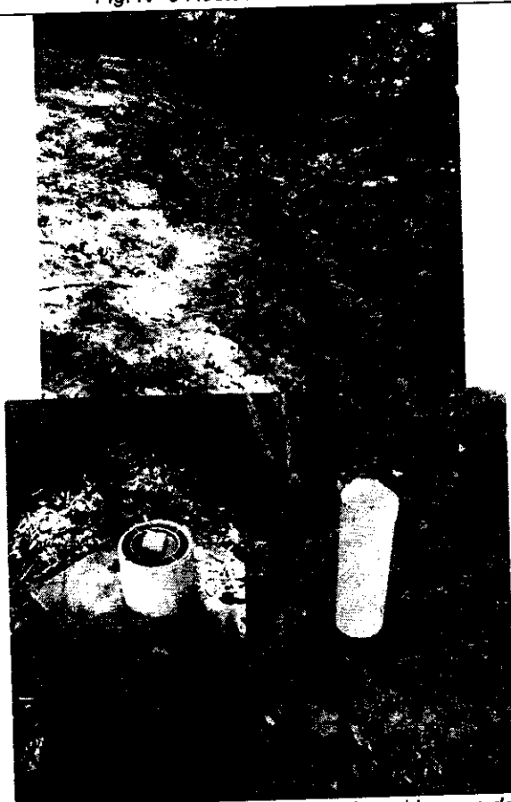
Fig. N° 7 Piezómetro en buen estado y chimenea de desfogue en mal estado y partida.