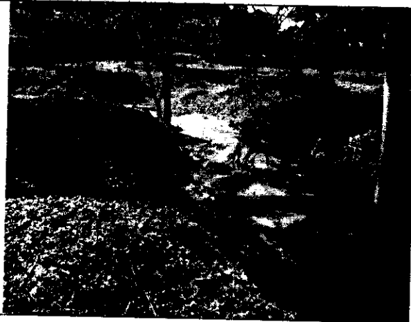
Fig. N° 4 Cuerpo de agua dentro del predio.