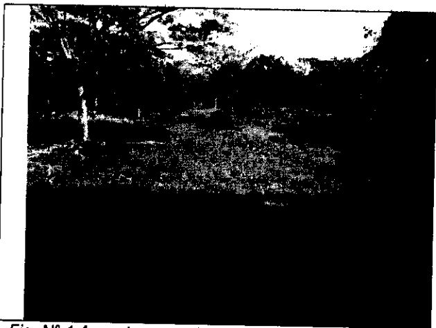
Fig. N° 1 Aspecto general de predio del antiguo botadero a cielo abierto.