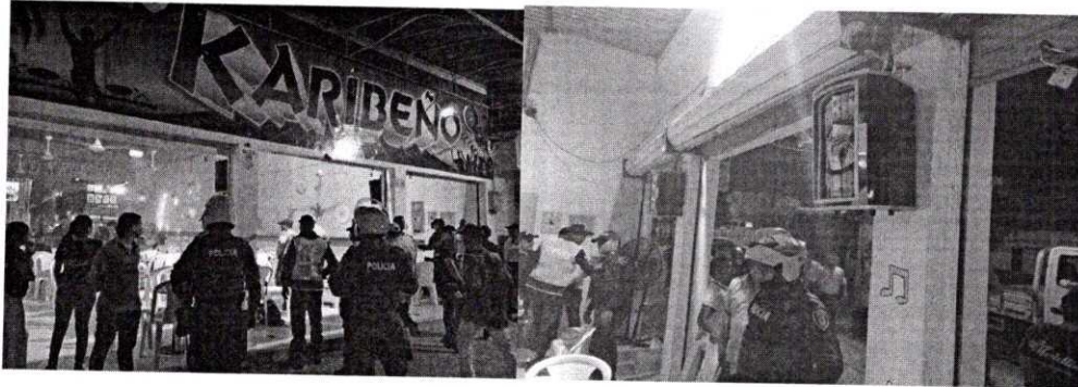
Fachada del establecimiento