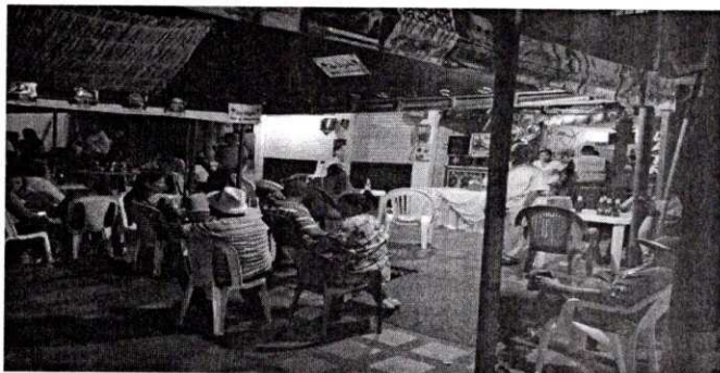
Disposición de sillas y mesas en el exterior