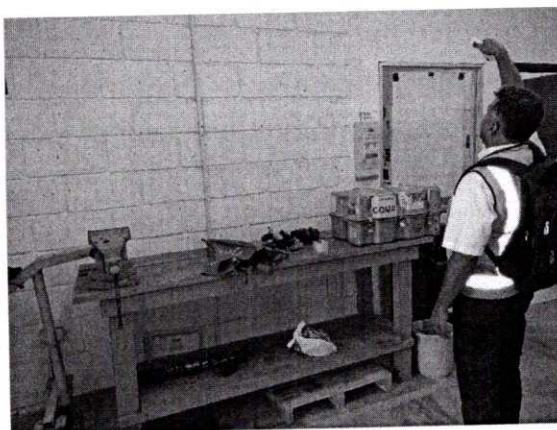
Imagen 3. Área de labores zona de mantenimiento