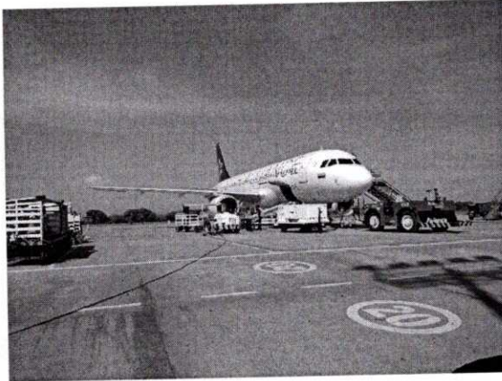
Imagen 1. Avión en pista propiedad de AVIANCA.