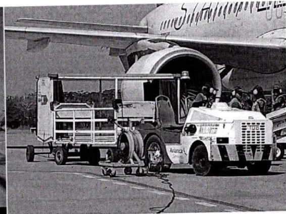
Imagen 2. Logística del Avión.