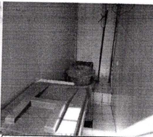
Imagen 2. Imagen interior del almacenamiento central, no hay segregación de residuos