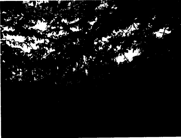
Foto 1. Punto de captación sistema de acueducto rural corregimiento Los Gómez