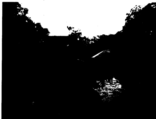
Foto 6. Estado de unidades de tratamiento de la PTAP del sistema de acueducto del corregimiento Los Gómez

Con base a lo evidenciado, las unidades de tratamiento de la PTAP no se encuentran en funcionamiento, presentando proliferación de algas y material vegetal al interior de las mismas, lo que denota la ausencia de mantenimiento, limpieza y estado de abandono de las mismas.