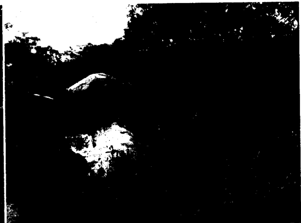
Foto 4. Estado de unidades de tratamiento de la PTAP del sistema de acueducto del corregimiento Los Gómez