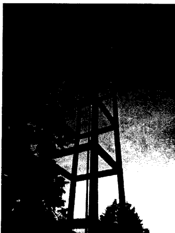
Foto 5. Estado de unidades de tratamiento de la PTAP del sistema de acueducto del corregimiento Los Gómez