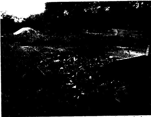
Foto 3. Estado de unidades de tratamiento de la PTAP del sistema de acueducto del corregimiento Los Gómez

La Planta de Tratamiento de Agua Potable-PTAP del sistema de acueducto del corregimiento Los Gómez, se ubica a aproximadamente 40 metros del punto de captación, localizada sobre las coordenadas geográficas N 09°3'19,64", W 75°50'41,96".