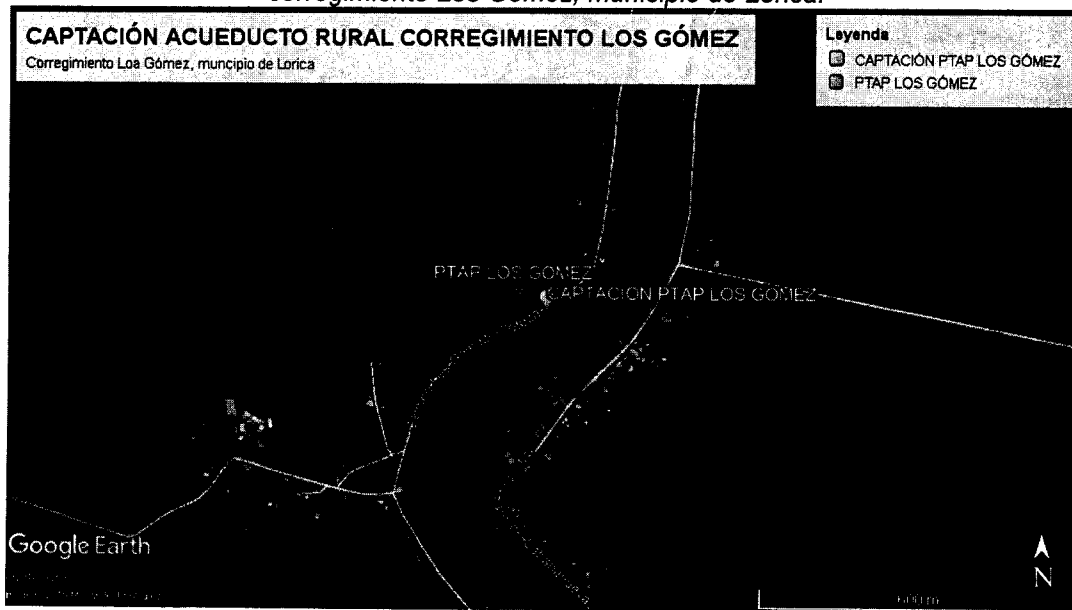
Imagen No. 1. Ubicación geográfica punto de captación y PTAP del sistema de acueducto rural del corregimiento Los Gómez, municipio de Lorica.