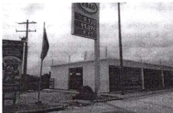
Imagen 1. Estación EDS-ESSO. Área de Construcción. Tocón volcado individuo Coco.

En tanto, comparando las imágenes suministradas por el solicitante y la obtenida en campo en el área de ubicación de la obra de construcción, donde a la fecha no se evidencia la presencia de individuos en pie de Coco ( Cocos nucifera ), se presume su tala para llevar a cabo la obra y cuyos residuos sobrantes corresponden a los tocones observados.