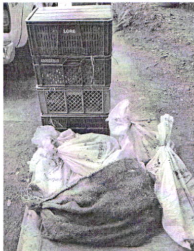
Figura 1. Especímenes incautados en el interior de los elementos utilizados para transportarlos.