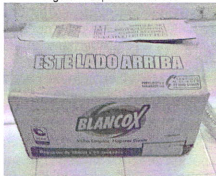
Figura 2. Elemento con que era transportado