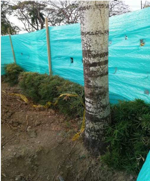
Imagen 3. Ubicación de Palmeras