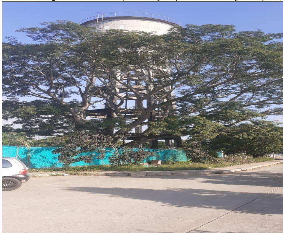
Imagen 2. Árbol de especie orejero ( Enterolobium cyclocarpum )

La especie, el DAP (Diámetro a la Altura del Pecho), la altura calculada y el volumen obtenido durante el desarrollo de la visita, se pueden observar en la Tabla 1