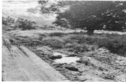
Figura 6. Vías de acceso en mal estado