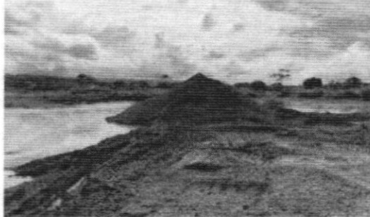
Figura 4. Material inadecuadamente acopiado