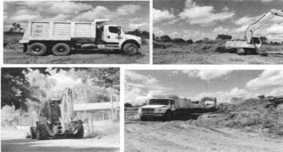
Figura 2. Maquinaria utilizada en la extracción