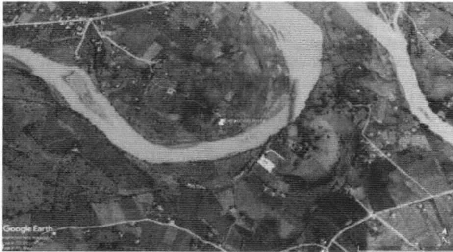
Figura 1. Localización Zona de extracción ilícita

Por lo anterior, el día 23 de noviembre de 2022, funcionario de la CAR-CVS, realizó visita de inspección, control y verificación a la denuncia presentada, en el municipio de Tierralta, corregimiento Callejas.