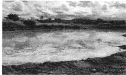
Figura 5. Cuerpo de agua sedimentado