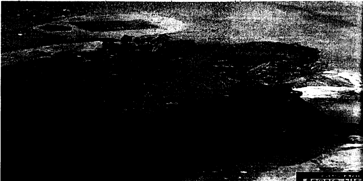
Imagen 2. Tocón de la especie Almendro ( Terminalia Catappa )

La especie, el DAP (Diámetro a la Altura del Pecho), la altura calculada y el volumen obtenidodurante el desarrollo de la visita, se pueden observar en la Tabla 2.