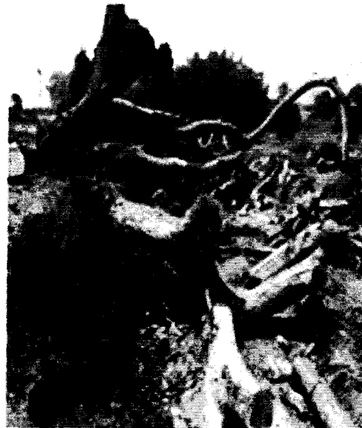
Imagen 5. Tocón y fuste del individuo N°4 de la especie Campano ( Samanea saman ), el cual se encontraba plantado cerca de un arroyo que pasa por la mitad de la finca.