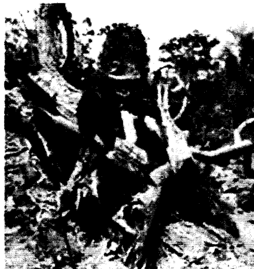
Imagen 4 Tocón y fuste del individuo N°3 de la especie Campano ( Samanea samán ), el cual se encontraba plantado cerca de un arroyo que pasa por la finca.