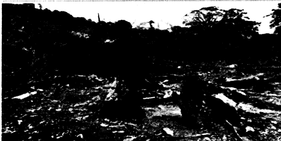
Imagen 3 Tocón y fuste del individuo N°2 de la especie Campano ( Samanea samán ), el cual presentaba un buen estado fitosanitario